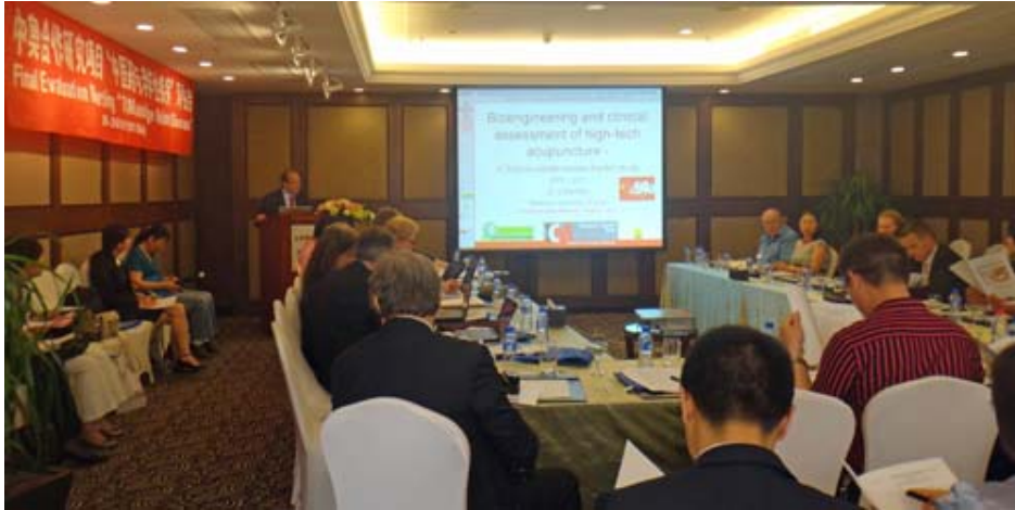
Am 29. und 30. Mai 2011 fand das Final Evaluation Meeting zum Projekt „Traditional Chinese Medicine and Age Related Diseases“ statt.