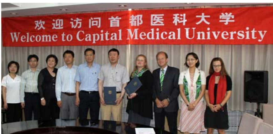
Vertragsunterzeichnung an der Pekinger Capital Medical University.

Medizinische Universität Graz, Universitätsplatz 3, A-8010 Graz. www.medunigraz.at .