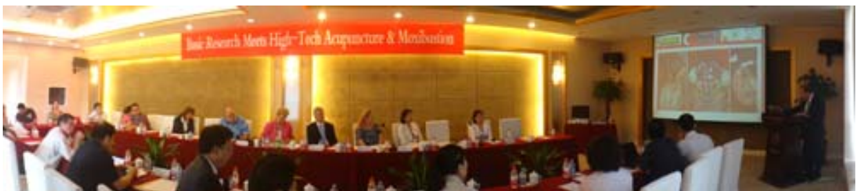
Med Uni Graz veranstaltete erstes „Transkontinentales High-Tech Akupunktursymposium“ in Peking.